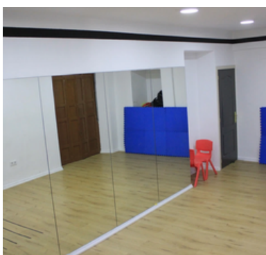
Sala de Teatro